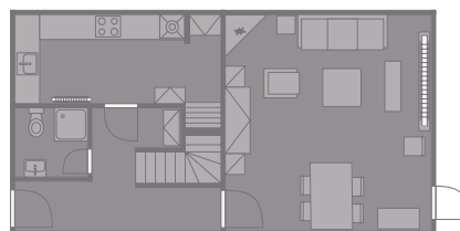
Erdgeschoss Flur; Gäste-WC mit Dusche; komplett eingeriichtete, separate Küche mit Nespresso-Maschine; Wohnzimmer mit Kamin, Essbereich und TV.