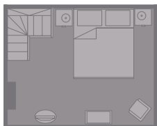
Spitzgiebel 1 Doppelzimmer.