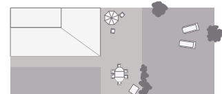
Garten Eingewachsener, ruhiger Garten, Südwest-Terrasse mit Gartenmöbeln und Strandkorb.